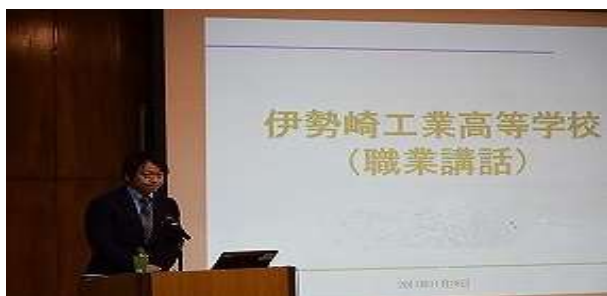
進路講演会の様子

機械・電気等の基礎技術を総合的に学び、将来の技術革新にも対応できる技術者の育成を目指しています。また進路講演会等も実施し、卒業後の進路を考える機会も用意しています。