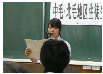
中北毛地区生徒生活体験発表大会の様子