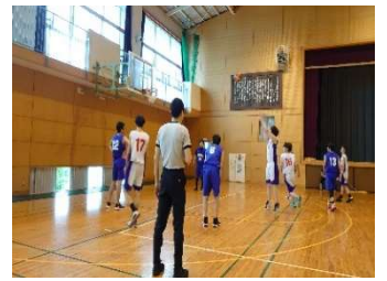
試合中の様子（バスケットボール部）